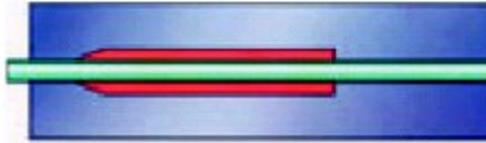
Figuur 3. In verband met de lagere lasstroom bij het kortsluitboog lassen, is het aan te bevelen de contactbuis iets uit het gasmondstuk te laten steken.