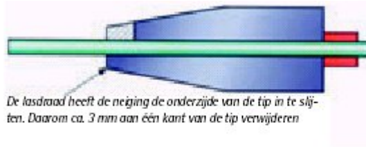
De lasdraad heeft de neiging de onderzijde van de tip in te slijten. Daarom ca. 3 mm aan één kant van de tip verwijderen

Veel gebruikers vinden het verbruik van de vele tips als gevolg van slijtage of onjuist gebruik een grote kostenpost. TWI adviseert voor het verlengen van de levensduur van de tip, de onderzijde een klein stukje te verwijderen (zie figuur 2). Door de altijd aanwezige kromming in de lasdraad als deze van de haspel afgewikkeld wordt, zal de boring in de contacttip elipsvormig uitgesleten worden. Door nu circa 3mm te verwijderen, zoals in figuur 2 aangegeven, wordt dit voorkomen en wordt de levensduur verlengd.