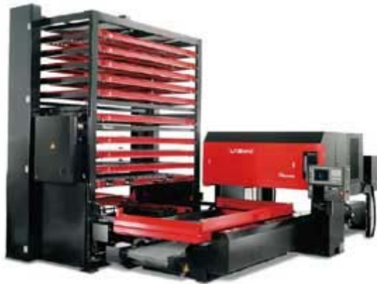
Amada lasersnij-installatie met automatisch materiaalopslag en pallet wisselsysteem

In feite is het mogelijk om voor iedere materiaaldikte de ideale brandpuntsafstand te kiezen. Dit zou dan wel inhouden dat de lens regelmatig verwisseld moet worden, met als gevolg ongewenste productiestilstand. In de praktijk wordt daarom voor een compromis tussen de brandpuntsafstand en de mogelijke snijsnelheid gekozen, tenzij er aan een product speciale eisen gesteld worden.