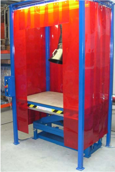
Ergonomische lastafel met afzuiging

De meest efficiënte methode om de blootstelling aan lasrook te beheersen is om de lasrook aan de bron af te zuigen. Hiervoor zijn verschillende methoden beschikbaar: