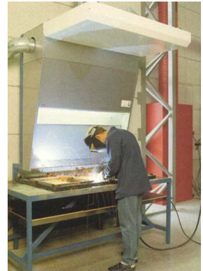
Lastafel met achterwand afzuiging