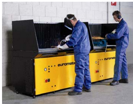
Lastafel met onderafzuiging