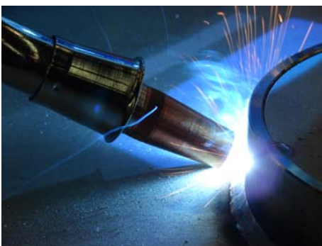
MAG-pistool met geïntegreerde lasrookafzuiging